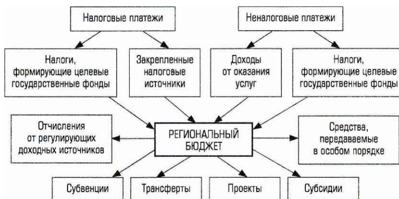
Рисунок – 1 Модель формирования регионального бюджета (бюджета субъекта Федерации)

Они формируются (пополняются) за счет нормированной части федеральных налогов и сборов, а также исключительно региональных налогов и сборов, штрафов, займов, лотерей и т.п. (рис. 4.1).