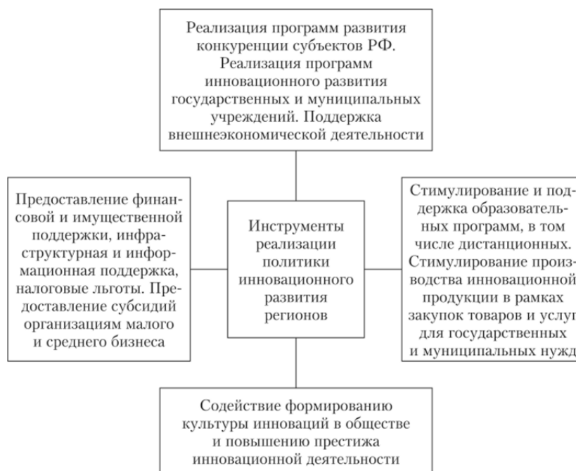
Рисунок 1 - Инструменты реализации политики инновационного развития

Инструменты реализации политики инновационного развития представлены на рисунке 1.