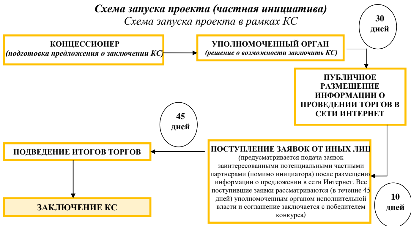
Схема запуска проекта в рамках СГЧП/СМЧП